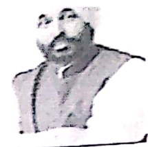
ਬਰਾਵੰਤ ਮਾਨ ਮੁੱਖ ਮੰਤਰੀ ਪੰਜਾਬ

ਘੱਟ ਗਿਣਤੀ ਮੰਤਰਾਲੇ, ਭਾਰਤ ਸਰਕਾਰ ਵਲੋਂ ਛੇ ਘੱਟ ਗਿਣਤੀ ਵਰਗ (ਜਿੱਥ, ਮੁਜ਼ਲਿਮ, ਬੋਧੀ, ਪਾਰਸੀ, ਜੈਨ ਅਤੇ ਟਿਸਾਈ) ਦੇ ਵਿਦਿਆਰਥੀਆਂ ਨੂੰ ਪ੍ਰੀ-ਮੈਟ੍ਰਿਕ, ਪੋਸਟ ਮੈਟ੍ਰਿਕ ਸਕਾਲਰਸ਼ਿਪ ਅਤੇ ਮੈਰਿਟ-ਕਮ-ਮੀਨਜ਼ ਬੇਸਡ ਸਕਾਲਰਸ਼ਿਪ ਦਾ ਨਾਂਬ 2022-23 ਦੌਰਾਨ ਪ੍ਰਾਪਤ ਕਰਨ ਲਈ ਇਕ ਮੌਕਾ ਦਿੱਤਾ ਗਿਆ ਹੈ। ਇਸ ਲਈ ਸਮਾਜਿਕ ਨਿਆਂ, ਅਧਿਕਾਰਤਾ ਅਤੇ ਘੱਟ ਗਿਣਤੀ ਵਿਭਾਗ, ਪੰਜਾਬ 100% ਰੋਂਦਗੀ ਪ੍ਰਾਯੋਜਿਤ ਟਿਨ੍ਹਾਂ ਸਕੀਮਾਂ ਅਧੀਨ ਨੈਸ਼ਨਲ ਸਕਾਲਰਸ਼ਿਪ ਪੋਰਟਲ www.scholarships.gov.in 'ਤੇ ਆਨਲਾਈਨ ਦਰਖਾਸਤਾਂ ਦੀ ਮੰਗ ਕਰਦਾ ਹੈ।